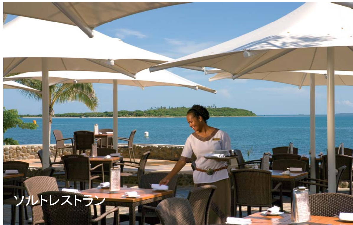
ソルトレストラン