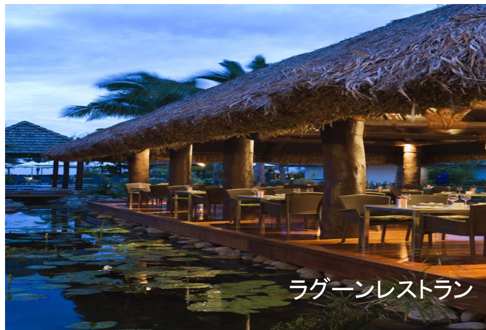
ラグーンレストラン