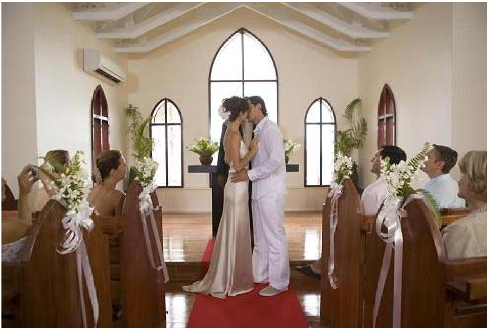
指輪の交換、誓いの口づけ、署名